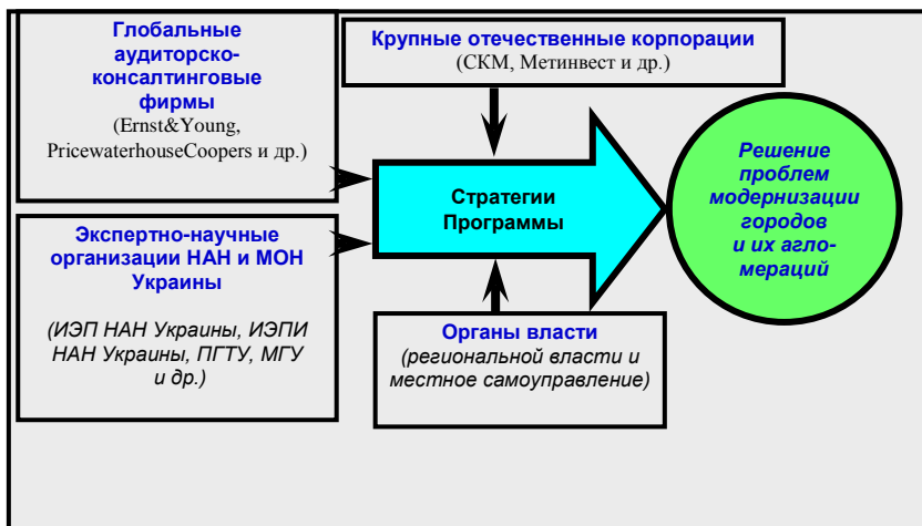
Рис. 3. Схема взаимодействия субъектов Стратегии развития территории

Донецка на период до 2020 года, которая успешно реализуется через ряд долгосрочных программ 1 . На основании данного документа городским советом совместно с Институтом экономики промышленности НАН Украины были разработаны Программа инвестиционного развития г. Донецка на период до 2020 года, Комплексная программа «Энергосбережение в г. Донецке на 2010-2014 годы», Целевая программа развития и поддержки малого и среднего предпринимательства в городе на период до 2020 года, Общие методические положения по развитию элементов региональной инфраструктуры микрострахования и гарантирования кредитов малому предпринимательству и ряд других. К числу стратегических направлений в развитии малого бизнеса города также следует отнести [9, с. 87-94]: